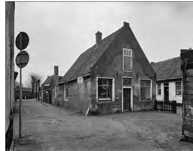
Afbeelding 18 Hoofdbuurtstraat 8 (na 1975 Middendorpstraat 6) als weefatelier in 1971. Het weefgetouw is achter het linker voorraam zichtbaar.