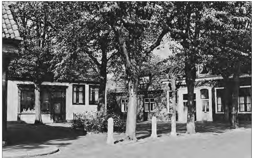
Afbeelding 1 Het pleintje van Bresser in 1961. Links de slagerij en rechts het voormalige huis van de schout.