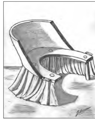
Afbeelding 3 Een kraamstoel. Tekening J. Morren, naar een historische afbeelding.

Het reglement en instructie voor de Vroedvrouw, art. 13 schrijft voor indien de kraamvrouw in het ambacht Velsen een vroedvrouw uit een andere plaats vraagt, de vroedvrouw in het ambacht Velsen het recht is gegeven om van deze kraamvrouw te vorderen een bedrag van 50 stuivers. Maar naar recht kan niet verstaan worden dat kraamvrouwen verplicht zijn om deze boete te betalen omdat in het reglement geen woord wordt gevonden dat zij verplicht zijn om de dorpsvroedvrouw te vragen voor een bevalling of verboden wordt om een andere vroedvrouw te vragen. Tevens wordt bevestigd dat op basis van de getuigenissen de vroedvrouw onjuist heeft gehandeld bij de bevallingen. In het reglement wordt in het vierde artikel ten overvloede aangehaald