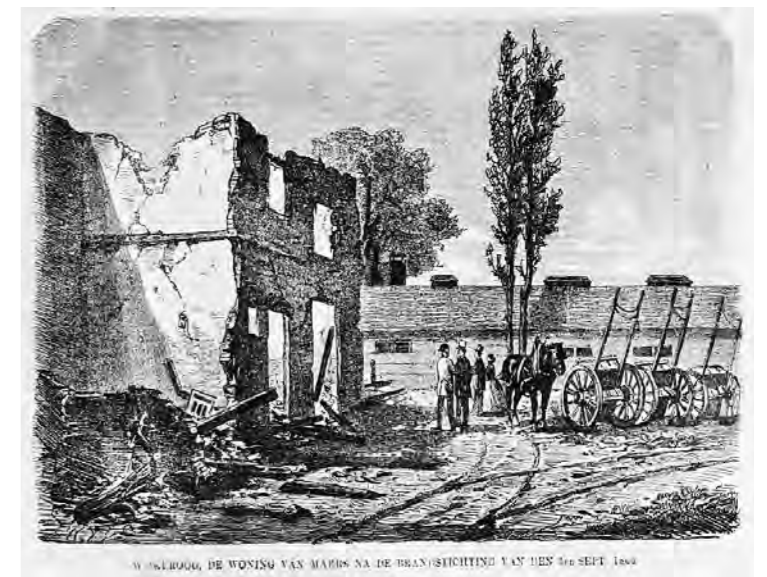
Afbeelding 6 Het huis waar de opzichter Marss woonde na de brandstichting in 1866.

In 1889 werd aan de westzijde van het huis van de vroedvrouw de uitbouw voor een deel afgebroken. Op het westelijk deel van het erf werd een ruime bergplaats gebouwd en een schutting met poort geplaatst, beide van gepotdekselde eikenhouten delen.