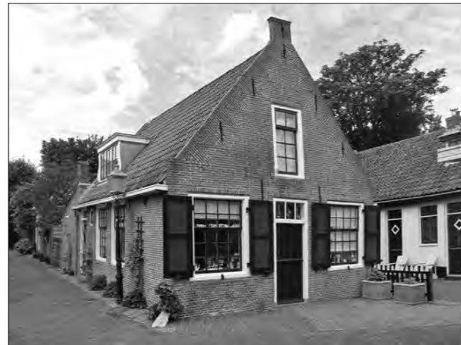
Afbeelding 21 Het voormalige huis van de Vroedvrouw, zuidoost zijde.