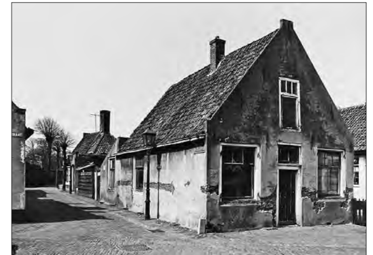
Afbeelding 17 Het voormalige huis van de Vroedvrouw in 1975.

van het verkeer bij de pont. In 1927 werd hij overgeplaatst naar Santpoort en verhuisde hij met zijn gezin naar de Pastoorstraat 26 te Santpoort. De straat lag in de woonbuurt de Elta, deze buurt stond minder goed bekend en was geen ideale woonomgeving voor een agent van politie. In 1929 verhuisde hij dan ook naar de Bloemendaalsestraatweg 182. Zijn 12½-jarig ambtsjubileum in Velsen vierde hij in 1933.