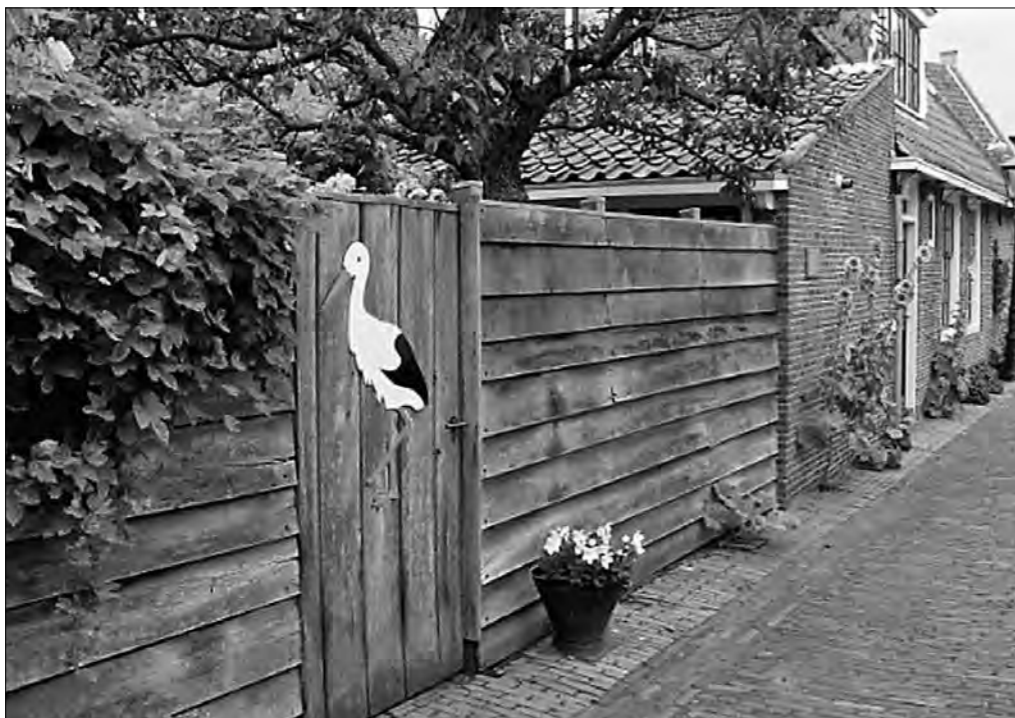
Afbeelding 2 Ooievaar als geboortesymbool op de poort van het Huis van de vroedvrouw aan de Middendorpstraat.