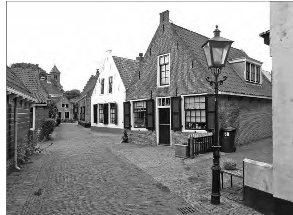
Afbeelding 22 Het voormalige huis van de Vroedvrouw, noordoostzijde.

Door de plaatsing van de voordeur aan de zijde van de Middendorpstraat veranderde het adres naar Middendorpstraat 6. De raamkozijnen zijn van een oorspronkelijk model, waarin een oude roede-verdeling werd aangebracht die rond 1750 gebruikelijk was. De werkplaats en de schutting ten westen van het huis werden vervangen door een schuur en een nieuwe schutting die evenals in 1889 opgetrokken werden van gepotdekseld eikenhout. 24