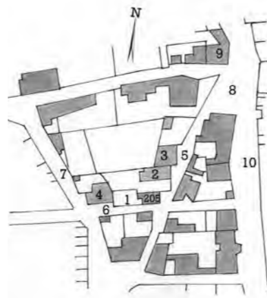
Afbeelding 5 De omgeving van het huis van de Vroedvrouw in 1832. 1 Het huis van de Vroedvrouw, 2 het huis De Morgenzon, 3 De wagenmakerij met woning, 4 het huis Het Overschotje, 5 het Haerlemmervoetpad, 6 de Kerckwech, 7 de Rooswijckerweg, 8 het plein, 9 het huis van de Schout.