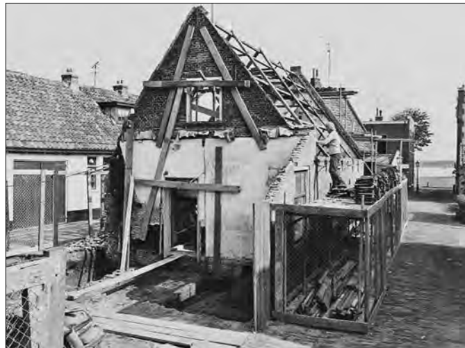
Afbeelding 20 De restauratie van het voormalige huis van de Vroedvrouw in 1975.