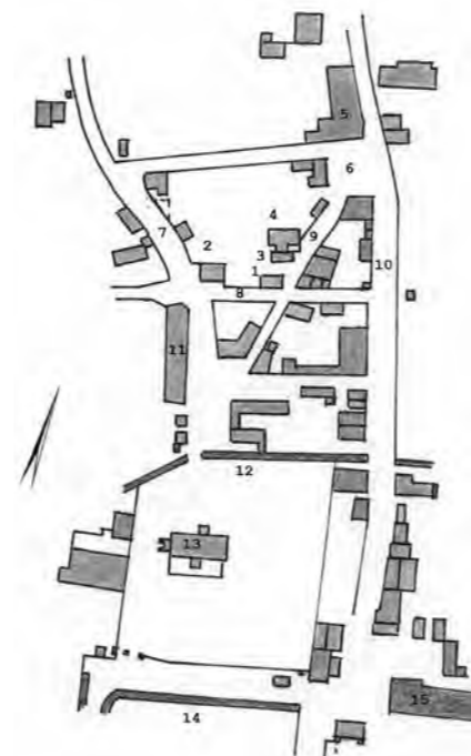
Tekening J. Morren, naar de brandweerkartaal uit 1760, origineel Noord-Hollands-Archief Haarlem.

dat een kraamvrouw bij noodzaak een andere vroedvrouw mag vragen. Tevens wordt in artikel 12 gesteld dat de vroedvrouw buiten het ambacht haar functie mag uitoefenen. Aan het gerecht in Velsen wordt geadviseerd om de eiser zijn eisen te ontzeggen en de kosten aan de eiser te compenseren.